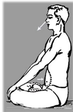
උදර උරහිස් පේශි සංකෝචනය කර හුස්ම කිරීම

හුස්ම උඩුතොළ හෝ නාස් පුඩු ස්පර්ශ කරමින් ඇතුළු වීමත්, පිට වීමත් පිළිබඳ අවධානය යොමු කල හැකිය. (ආනාපාන සති) එසේත් නැතිනම් උදරයේ ඉහළ පහළ යාම (අත උදරය මත තබා මෙය සිදුකල හැක.) කෙරෙහි අවධානය යොමු කල හැක. මෙලෙස ආශ්වාස ප්‍රාශ්වාස මත අවධානය යොමු කිරීම මගින් සිත ඒකාග්‍රකර ගැනීමට උත්සාහ කල යුතුය.