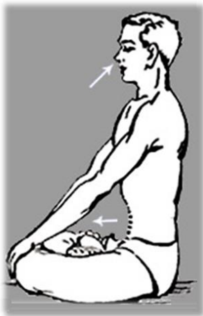
උදර, උරහිස් පේශි විස්ථාරණය කර හුස්ම පිටට ශරීරය තුළට ගැනීම